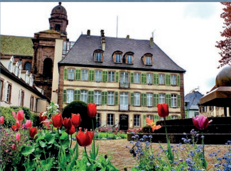
Le jardin du Musée Théodore Deck

Ce musée de France conserve la plus importante collection publique de faïences signées par Théodore Deck. Né à Guebwiller en 1823, Théodore Deck ouvre sa manufacture de faïences d'art à Paris et achève sa carrière comme directeur de la Manufacture Nationale de porcelaine de Sèvres. Il consacre sa vie à la maîtrise de son art : la faïence.